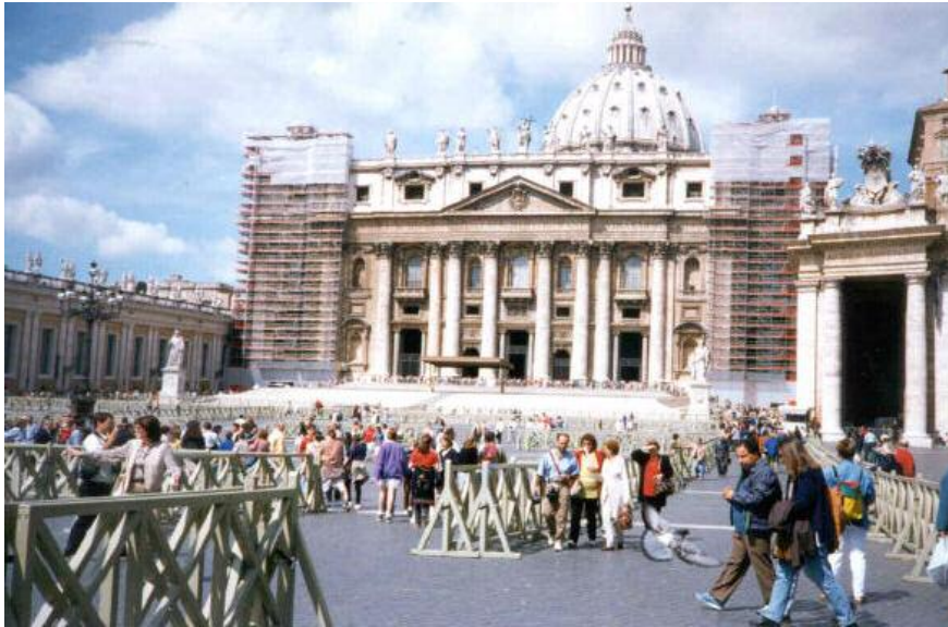
دیمه‌نیکی کلیسای سان پیتر له رۆما St peter's